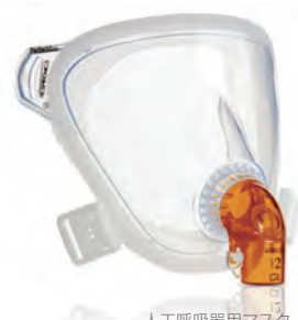
人工呼吸器用マスク パフォーマックス トータルフェイスマスク 1人の患者用