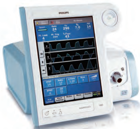
成人人工呼吸器 V60 ベンチレータ

この度の機器展示では、マスクの新製品「AF541フルフェイスマスク」をはじめとするシングルユースマスクのラインナップをご紹介します。また、その他の急性期で使用される機器に加え、NPPV教育用動画についてもご案内致します。フィリップスのソリューションを是非ブースにてご体感ください。