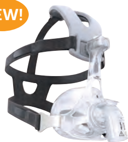
人工呼吸器用マスク AF541 フルフェイスマスク