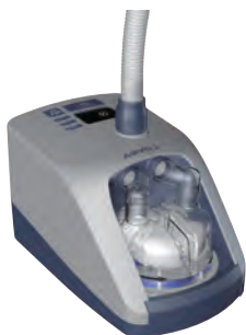
加熱式加湿器 フロージェネレーター Airvo