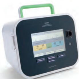
気道粘液除去装置 カファシスト E70